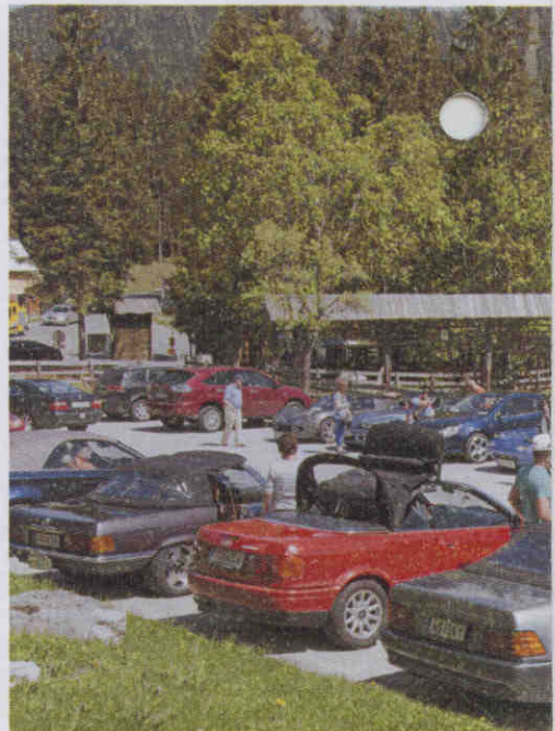
Das schöne Wetter lockte viele Teilnehmer

In diesem Jahr ist vieles neu. Die neuen Gastgeber haben es geschafft, innerhalb kürzester Zeit ein Programm auf die Beine zu stellen, welches euch bisher sicher gefallen hat. Ihr seid sozusagen die Erfahrungssammler für uns und umgekehrt. Damit ihr ein wenig nachfühlen könnt, wie es ist mit einem völlig neuen Team perfekte Arbeit zu leisten ;-), haben wir uns für die diesjährige Rätselfahrt rund um den Faaker See ein gänzlich neues Konzept überlegt.