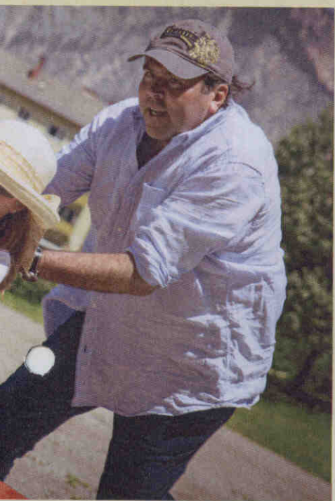
Antrieb. Mercedes versucht enlage.

Wir danken den Sponsoren des Cabriolet-Festivals 2014: Holiday Inn Villach • Hotel Karnerhof, Egg am Faaker See • Hotel Seerose, Bodensdorf • Falkensteiner, Bad Bleiberg • Gerlitzten Kanzelbahn • Terra Mystica, Bad Bleiberg • Region Villach • Droneberger Showtechnik • remotion Entertainment • Gasthof Pension Feichter, Finkenstein • Gasthof Millonig, Gödersdorf • Naturel Hotels & Resorts • Affenberg, Landskron • Villacher Bier • C&C Pfeiffer • Finkensteiner Nudelfabrik • Weberhof, Egg